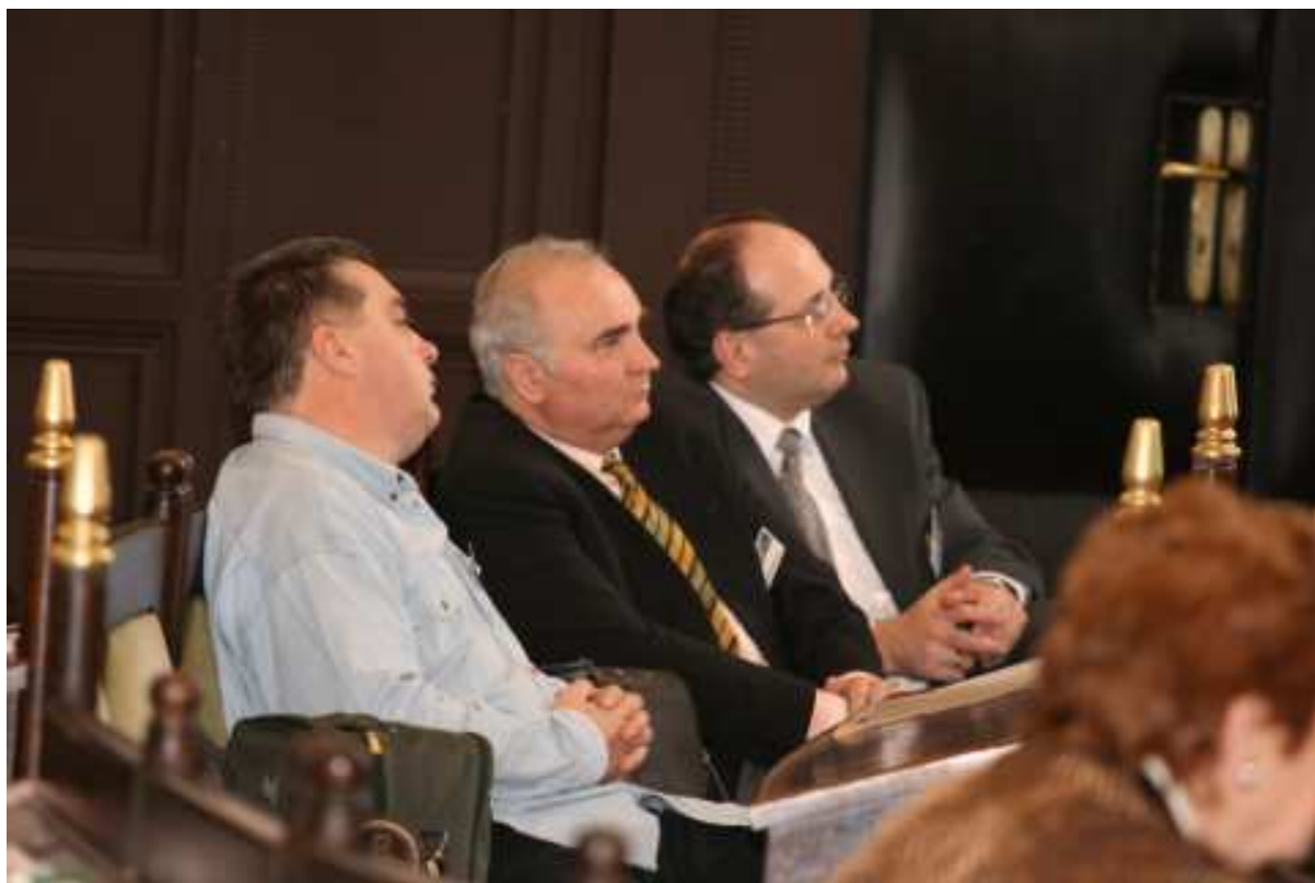
Tanácskozás Debrecenben, 2007.

anyagának folyamatos gyűjtése, nyilvántartása, megőrzése, és restaurálása, tudományos feldolgozása és publikálása, valamint kiállításokon és más módon történő bemutatása.”